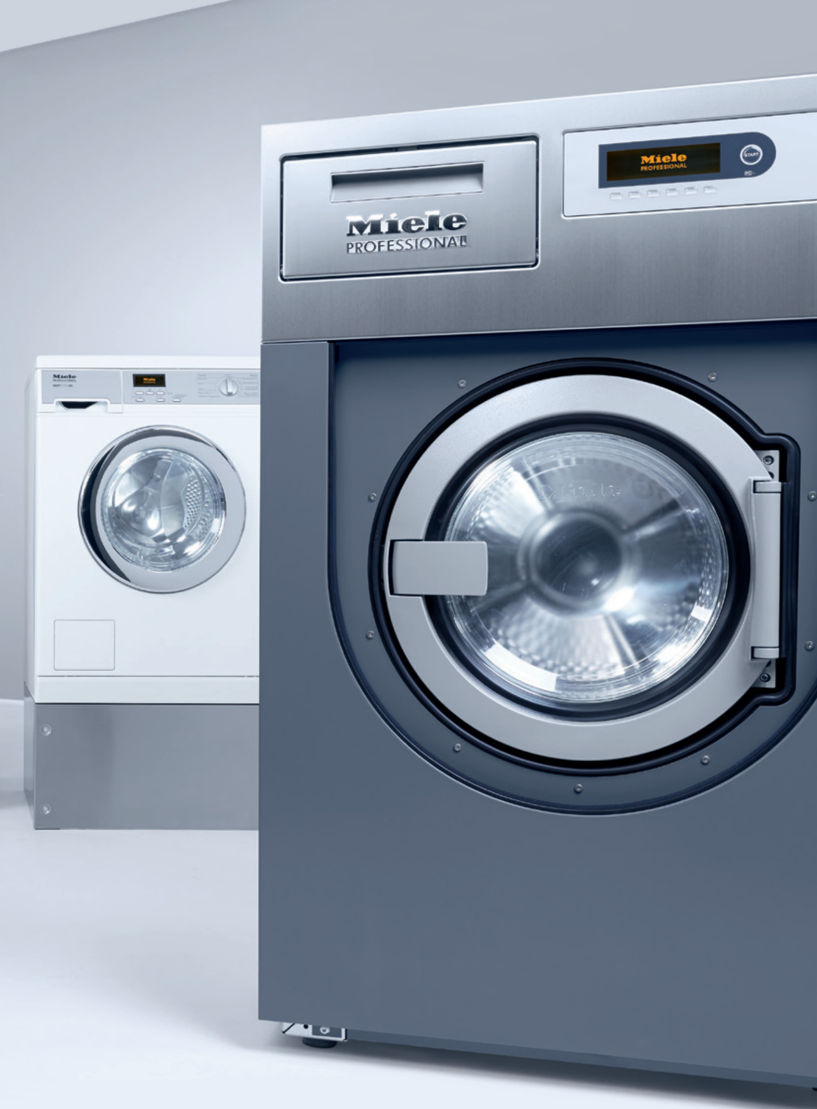
MOPSTAR 100, MOPSTAR 80 på sokkel US 6008, MOPSTAR 60 på sokkel UG 5005, MOPSTAR 130 (fra venstre mod højre)