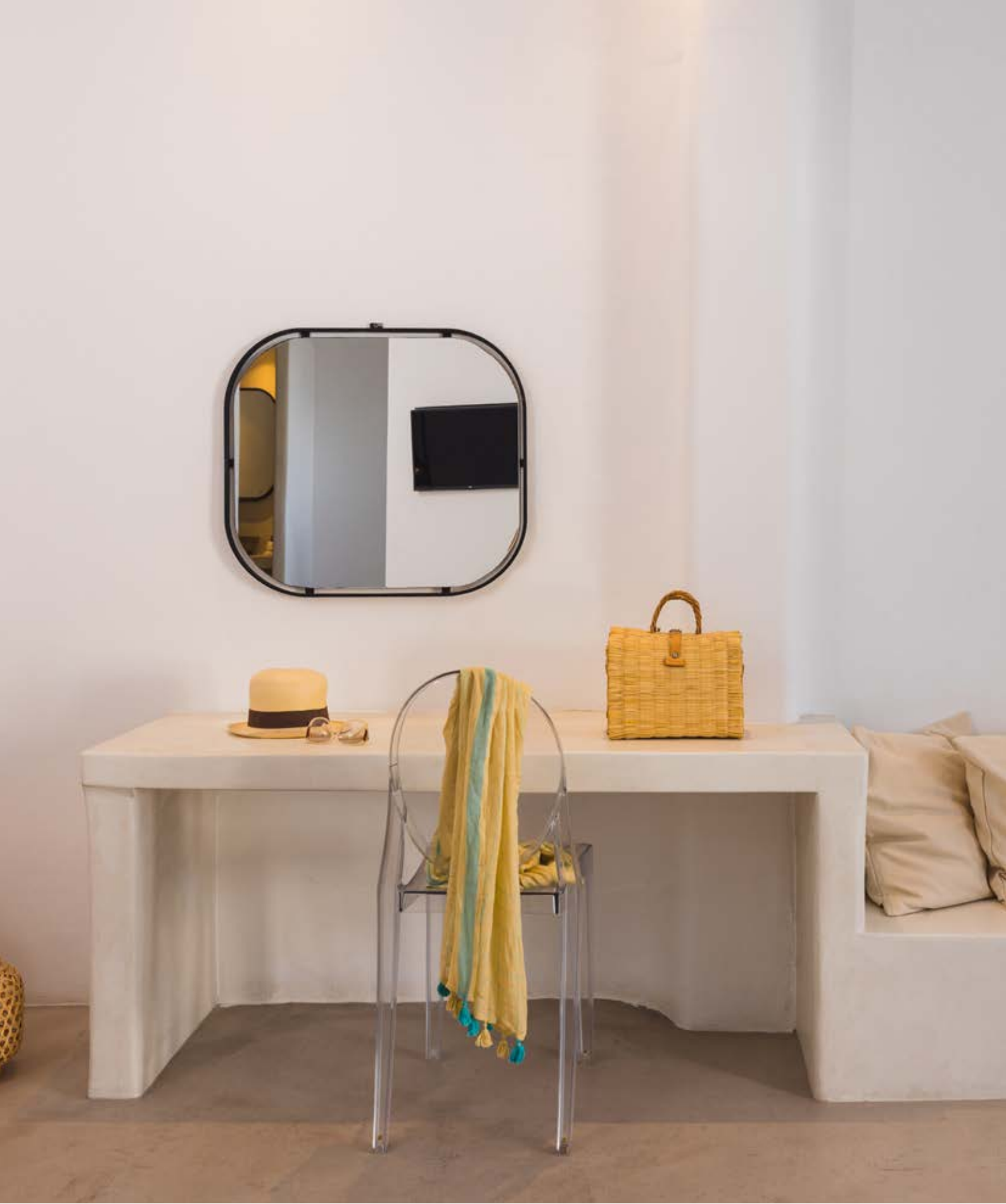
Rocabella'daki 42 oda ve süit, adanın Akdeniz havasını yansıtan sade ve estetik bir tasarıma sahip.