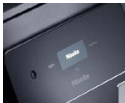
M Touch Basic

Die Variante M Touch Flex mit Farbdisplay bietet zusätzlichen Komfort: Durch Tippen und Wischen können Sie unter anderem Programmnamen ändern und einzelne Schritte über anschauliche How-to-Sequenzen verfolgen. Einfach, sicher, komfortabel.