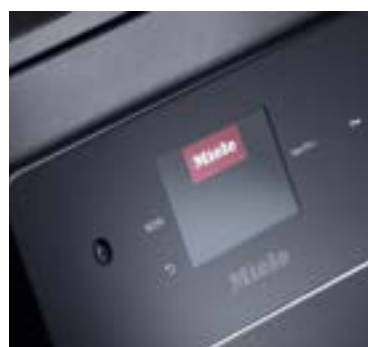
M Touch Flex