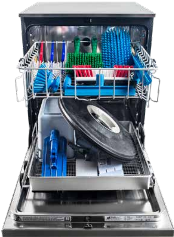
Esimerkki koneen täytöstä

Mielen moppipesukonetta täydentää nyt lämpödesinfiioiva pesuautomaatti PFD 407TD siivousvälineiden (mm. moppipesimien levykehukset, teräväkuivaimet, pesuharjat, tiskiharjat) ja lelujen pesuun ja lämpödesinfiointiin. Miele PFD 407TD pesee ja desinfiioi kaksi korillista siivousvälineitä tai leluja vain 15 minuutissa!