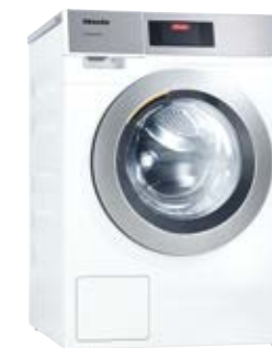
Kleine Riesen Waschmaschine PWM 907 Self Service

Optimiert für den Self-Service-Bereich, platzsparend (711 mm) und einfach zu transportieren. Schnelle Trocknung durch diagonale Luftführung. 11 kg Füllgewicht.