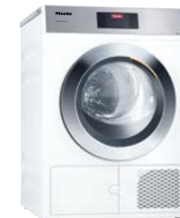
Kleine Riesen Trockner PDR 908 HP

Platzsparend und perfekt für den Self-Service-Bereich mit spezialisierten Waschprogrammen. Kompakt, 7 kg Füllgewicht und getestet für intensive Nutzung.