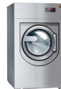
Benchmark Waschmaschine PWM912

Energieeffizienter Wärmepumpentrockner mit kurzen Laufzeiten. Kompakt, 8 kg Füllgewicht und für intensive Nutzung getestet.