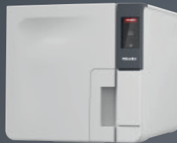
Cube PST 2210