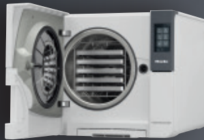
Cube X PST 1720