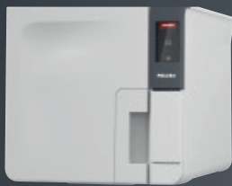
Cube PST 1710