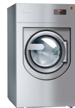
Benchmark Lavatrice PWM 912

Asciugatrice a pompa di calore ad alta efficienza energetica con durate ridotte. Compatta, con un carico di 8 kg e testata per un uso intensivo.