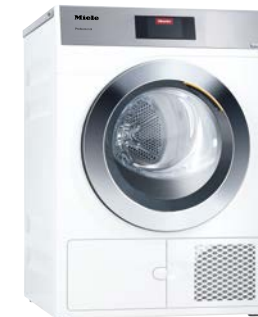
Piccoli giganti Essiccatoio PDR 908 HP

Salvaspazio e perfetta per il settore self-service con programmi di lavaggio specializzati. Compatta, con un carico di 8 kg e testata per un uso intensivo.