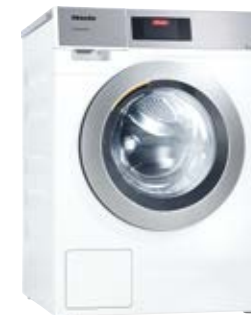
Petits Géants Lave-linge PWM 908

Optimisé pour le libre-service, peu encombrant (711 mm) et facile à transporter. Séchage rapide grâce à un guidage d'air en diagonale. Charge de 11 kg.