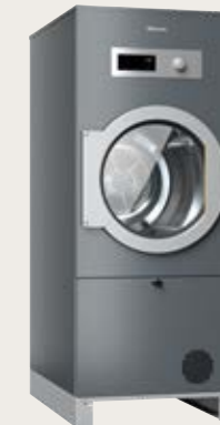
SlimLine Sèche-linge PDR 511 SL HP

Scannez simplement le QR code pour découvrir les appareils Miele Professional adaptés. www.miele-professional.ch/ Systemes-libre-service/Produits