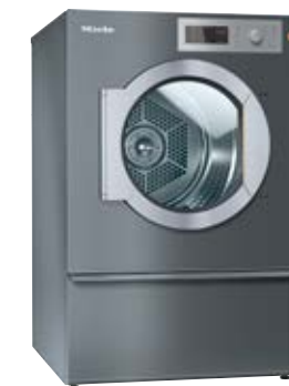
Benchmark Sèche-linge PDR 914

Convaincant avec M Touch Pro Plus, verrouillage de porte automatique, programmes rapides, capacité de 12 kg et le tambour Hydrogliss breveté.