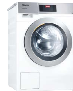
Kleine Riesen Waschmaschine PWM 908

Optimiert für den Self-Service-Bereich, platzsparend (711 mm) und einfach zu transportieren. Schnelle Trocknung durch diagonale Luftführung. 11 kg Füllgewicht.