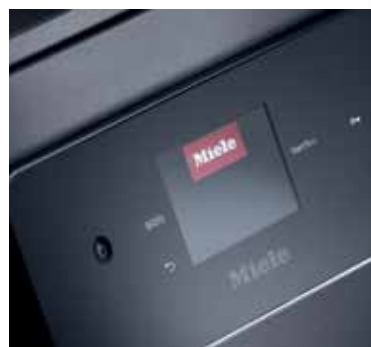
M Touch Flex