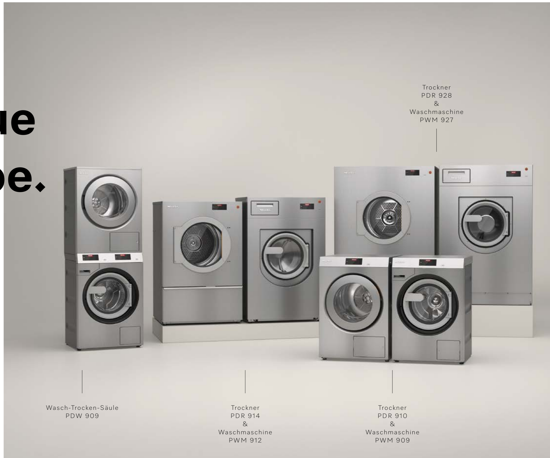
Wasch-Trocken-Säule PDW 909

Marketing Managers please update to local URL