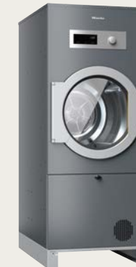
SlimLine Trockner PDR511 COP SL HP

Einfach QR-Code scannen und die passenden Geräte von Miele Professional entdecken. www.miele-professional.at/pro/self-service-products