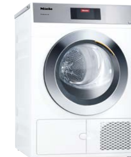
Kleine Riesen Trockner PDR 908 HP

Platzsparend und perfekt für den Self-Service-Bereich mit spezialisierten Waschprogrammen. Kompakt, 7 kg Füllgewicht und getestet für intensive Nutzung.