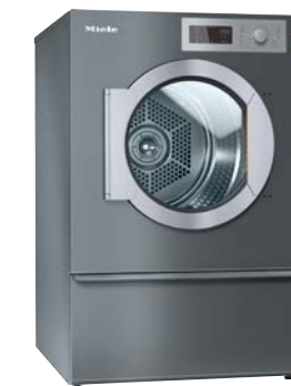
Benchmark Trockner PDR 914 COP

Überzeugt mit M Touch Pro Plus, automatischer Türverriegelung, schnellen Programmen, 12 kg Fassungsvermögen und der patentierten Schontrommel.