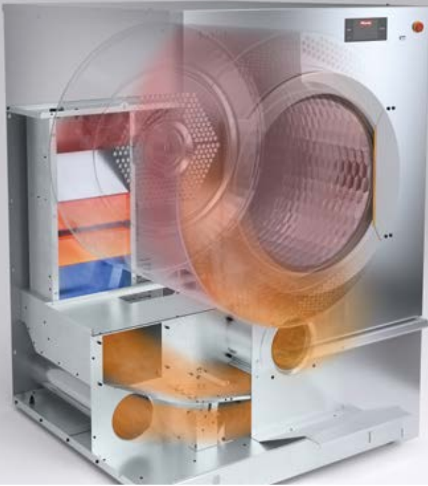
Funktion AirRecycling Flex