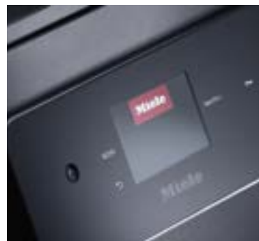
M Touch Flex