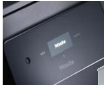
M Touch Basic

Die Variante M Touch Flex mit Farbdisplay bietet zusätzlichen Komfort: Durch Tippen und Wischen können Sie unter anderem Programmnamen ändern und einzelne Schritte über anschauliche How-to-Sequenzen verfolgen. Einfach, sicher, komfortabel.