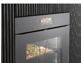
Immagine 3: In futuro, Smart Food ID riconoscerà ancora più alimenti e li preparerà automaticamente. (Immagine: Miele)

Immagine 2: Con la Consumption Dashboard di Miele, le e gli utenti hanno sempre una panoramica del consumo energetico dei loro elettrodomestici e possono confrontare i consumi nel tempo. (Immagine: Miele)