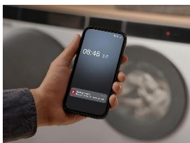
Immagine 1: Al Diagnostics offre un supporto per l'auto-aiuto in caso di guasto di un elettrodomestico.

Questo testo è accompagnato da tre immagini