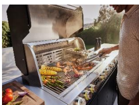
Photo 7 : Afin qu'il n'y ait aucun doute, même dans des conditions météorologiques difficiles, sur le fait qu'un ou plusieurs brûleurs sont allumés, un éclairage spécial indique leur état : jaune pour allumé, blanc pour éteint.