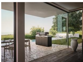
Photo 4 : Tout l'assortiment de la première cuisine d'extérieur de Miele est composé de matériaux de haute qualité adaptés à l'extérieur et capables de résister au soleil ou à la pluie 365 jours par an. Grâce à son design minimaliste, elle s'intègre parfaitement dans n'importe quel espace extérieur.