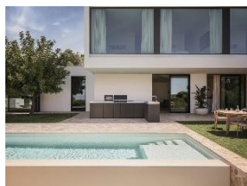
Photo 1 : Tous les modules de la cuisine d'extérieur de Miele peuvent être combinés de manière flexible, pour des cuisines de petite ou de grande taille, dans un jardin, sur une terrasse ou un balcon.