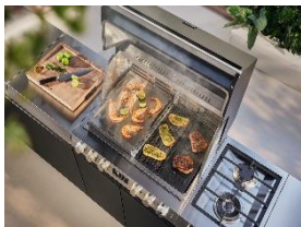
Photo 3 : Une interaction parfaite entre la grille et les accessoires : pour une utilisation repensée de la surface de gril modulaire du Fire Pro et du Fire Pro IQ grâce à différents accessoires en inox et en fonte.