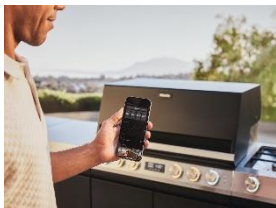
Photo 9 : Pour la première fois, il est également possible de régler le barbecue à distance ou d'envoyer au barbecue des paramètres de recettes CookAssist spécialement conçues via l'app Miele*. Les clientes et clients peuvent ainsi profiter de leur soirée avec leurs convives sans devoir la passer à côté du barbecue.

Pour télécharger le texte et les photos : https://www.miele.ch/fr/m/index-p.htm