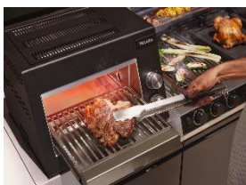
Photo 6 : Depuis plus de 126 ans, Miele est un fabricant d'appareils électroménagers premium, synonyme de qualité, de design haut de gamme, de simplicité d'utilisation et de fonctionnalités innovantes. Avec sa nouvelle catégorie de produits “Outdoor Cooking”, l'entreprise transpose désormais cette expertise à l'extérieur.