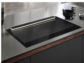
Photo 2 : Efficace et ouvert : la hauteur de déploiement moyenne des nouvelles hottes downdraft de Miele permet un guidage efficace de l'air tout en offrant une vue dégagée sur l'espace de vie.