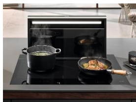
Photo 1 : Des accents de lumière pour une atmosphère agréable : le bandeau lumineux LED périphérique de la hotte downdraft Levantar Ambient assure un éclairage d'ambiance de la cuisine, même pendant la cuisson.