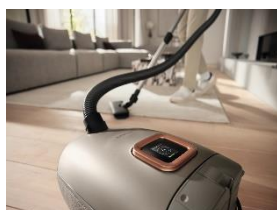
Photo 3 : Outre les quatre niveaux de puissance classiques pour les rideaux/textiles, les meubles rembourrés, les moquettes ou les sols durs, le Guard L1, modèle Comfort, propose un mode automatique à la fois pratique et intelligent. Celui-ci reconnaît automatiquement le revêtement de sol et adapte de lui-même la puissance pour obtenir les meilleurs résultats de nettoyage tout en optimisant la consommation d'énergie. (Photo : Miele)

Photo 2 : Le nouveau système ComfortFit assure un enclenchement fiable et une fermeture sûre grâce à une plaque de fixation spécialement conçue sur le sac à poussière et à son pendant sur l'aspirateur, ce qui est confirmé par un clic clairement perceptible. La poussière et la saleté sont ainsi capturées de manière encore plus sûre. Le sac à poussière HyClean Pure correspondant est composé à 80 % de matériaux recyclés et, avec 99,99 %*, offre la meilleure filtration du marché, même pour les plus petites particules de poussière. (Photo : Miele)