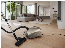
Photo 1 : Le Guard L1 est un appareil haut de gamme de conception entièrement nouvelle, qui offre de nombreuses caractéristiques exclusives Miele pour les exigences les plus élevées. Avec son design stylé alliant couleurs monochromes et applications métalliques pour encadrer l'élément de commande en or rose ou en cuivre, il s'intègre parfaitement dans tous les espaces de vie. Les ouvertures d'aération placées pour la première fois sur le côté sont protégées, selon le modèle, par un motif en diamant ou par un revêtement en tissu de haute qualité et antisalissant.