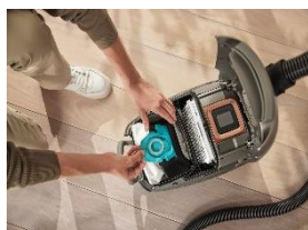
Photo 2 : Le nouveau système ComfortFit assure un enclenchement fiable et une fermeture sûre grâce à une plaque de fixation spécialement conçue sur le sac à poussière et à son pendant sur l'aspirateur, ce qui est confirmé par un clic clairement perceptible. La poussière et la saleté sont ainsi capturées de manière encore plus sûre. Le sac à poussière HyClean Pure correspondant est composé à 80 % de matériaux recyclés et, avec 99,99 %*, offre la meilleure filtration du marché, même pour les plus petites particules de poussière. (Photo : Miele)

Photo 1 : Le Guard L1 est un appareil haut de gamme de conception entièrement nouvelle, qui offre de nombreuses caractéristiques exclusives Miele pour les exigences les plus élevées. Avec son design stylé alliant couleurs monochromes et applications métalliques pour encadrer l'élément de commande en or rose ou en cuivre, il s'intègre parfaitement dans tous les espaces de vie. Les ouvertures d'aération placées pour la première fois sur le côté sont protégées, selon le modèle, par un motif en diamant ou par un revêtement en tissu de haute qualité et antisalissant. (Photo : Miele)