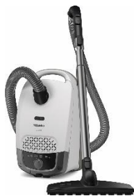
Photo 6 : Le Guard S1 est le nouveau modèle d'entrée de gamme compact et léger, ici en blanc brillant.

Pour télécharger le texte et les photos : https://www.miele.ch/fr/m/index-p.htm