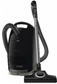
Photo 5 : Le Guard M1 est la nouvelle classe moyenne puissante et polyvalente, ici en noir obsidienne.