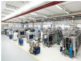
Photo 3 : Production pour l'industrie pharmaceutique à l'usine de Riese Pio X