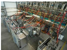
Photo 5 : Contrôle de la qualité des stérilisateurs Belimed avant leur livraison à la clientèle