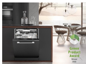
Photo 1 : Le Miele G 27465-60 SCVi XXL AutoDos a remporté le Green Product Award 2023 dans la catégorie Cuisine.