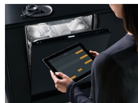
Photo 3 : L'indication transparente des valeurs de consommation dans l'application Miele a reçu des mots élogieux dans la décision du jury.

Pour télécharger le texte et les photos : https://www.miele.ch/fr/m/index-p.htm