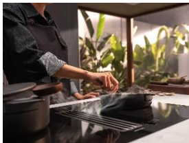
Photo 3 : Cuisiner durablement est plus qu'une tendance éphémère. L'app Miele propose désormais des recettes adaptées. (Photo : Miele)

Photo 2 : Le Consumption Dashboard de Miele donne un aperçu des consommations d'eau et d'électricité des appareils ménagers. Les utilisatrices et utilisateurs suisses pourront probablement utiliser le Dashboard à partir du quatrième trimestre 2024 et comparer leur comportement d'utilisation sur plusieurs mois. (Photo : Miele)