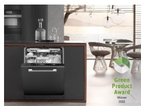
Photo 3 : Le Miele G 7465 SCVi XXL AutoDos a remporté le Green Product Award 2023 dans la catégorie Cuisine.