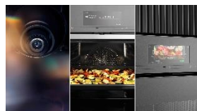
Photo 4 : La Suisse est l'un des premiers pays européens où Smart Food ID est déjà disponible. L'intelligence artificielle interprète la photo prise par la caméra du four et la préparation se poursuit automatiquement.