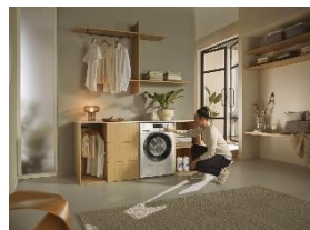
Photo 2 : Un équipement attrayant à des prix avantageux et, pour la première fois, la classe d'efficacité énergétique A moins 10 % : avec les trois appareils de la série promotionnelle "Performance", Miele complète encore sa gamme de lave-linge d'août à fin janvier.