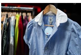
Photo 4 : Lors du “annabelle x Miele Swap”, le plus grand événement d'échange de mode de Suisse, une deuxième vie est donnée à des vêtements, des chaussures et des accessoires d'occasion.