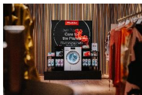
Photo 2 : Miele est présente à Mode Suisse en tant que sponsor principal et y décerne chaque année le “MIELE X MODE SUISSE AWARD FOR POSITIVE IMPACT” à des créatrices et des créateurs de mode suisses qui contribuent à rendre le secteur de la mode plus écologique et plus social à long terme.