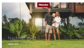
Photo 1 : La mise à jour sur la durabilité 2023 de Miele donne des informations sur les succès déjà obtenus et sur les projets actuels pour plus de durabilité.