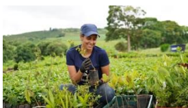
Photo 7 : Miele lance un projet de culture renouvelable du café au Brésil. Une collaboratrice du projet examine un plant de café sur la plantation.

Pour télécharger le texte et les photos : https://www.miele.ch/fr/m/index-p.htm