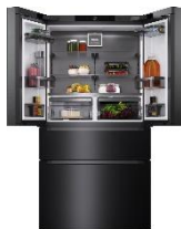
Foto 2: French Door Standgeräte: Das elegante Edelstahl setzt einen besonderen Akzent in der Küche, während «IceMaker» und «Freeze&Cool» höchsten Komfort und Flexibilität bieten.