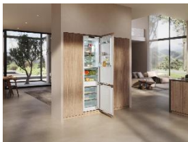
Foto 1: Deutlich mehr Platz für frische Lebensmittel: Das XXL-Einbaugerät bietet rund 45 Prozent mehr Volumen – ideal für grosse Wocheneinkäufe oder Vorbereitungen von Feiern.