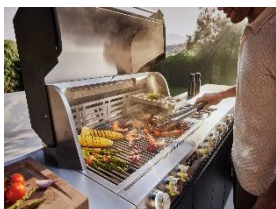
Foto 7: Damit auch bei schwierigen Witterungsverhältnissen kein Zweifel besteht, ob einer oder mehrere Brenner gezündet sind, zeigt eine besondere Knebelbeleuchtung den Status an: gelb für an, weiss für aus. (Foto: Miele)

Foto 6: Miele steht als Hersteller für Premium-Hausgeräte seit über 126 Jahren für Qualität, hochwertiges Design, einfache Bedienung und innovative Features. Mit der neuen Produktkategorie «Outdoor Cooking» überträgt das Unternehmen diese Expertise nun auf den Aussenbereich. (Foto: Miele)