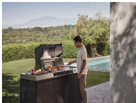
Foto 2: Mit seinen fünf Sensoren im Garraum und am Grillrost regelt der Fire Pro IQ die Temperaturen präziser als jeder andere Grill. Für noch mehr Komfort: Einfach ein Automatikprogramm in der Miele App auswählen, an den Fire Pro IQ senden und Schritt für Schritt zum perfekten Ergebnis geführt werden.