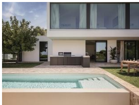
Foto 1: Alle Module der Miele Outdoor-Küche lassen sich flexibel miteinander kombinieren – für kleine und grosse Konfigurationen, im Garten, auf der Terrasse oder dem Balkon.