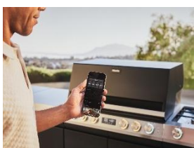
Foto 9: Erstmals kann der Grill auch über die verknüpfte Miele App* aus der Ferne geregelt oder Parameter von speziell entwickelten CookAssist-Rezepten an den Grill gesendet werden. Kundinnen und Kunden können so den Grillabend mit ihren Gästen geniessen, statt ihn am Grill verbringen zu müssen. (Foto: Miele)

Foto 8: Der intelligente Gasgrill «Fire Pro IQ» macht Grillen und Kochen präziser als je zuvor. Auf Knopfdruck heizt er innerhalb weniger Minuten auf die gewünschte Temperatur auf und regelt die Hitze in seinen vier Grillzonen selbstständig, wie ein Backofen. (Foto: Miele)