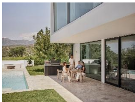
Foto 5: «Dreams» ermöglicht es Kundinnen und Kunden ihren individuellen Traum einer Outdoor-Küche zu erfüllen. Entstanden ist die erste Outdoor-Küche von Miele in Zusammenarbeit mit dem auf Grills spezialisierten Unternehmen Otto Wilde Grillers, das Miele 2023 übernommen hat.