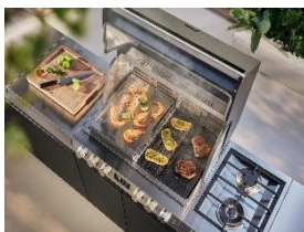
Foto 3: Ein perfektes Zusammenspiel aus Grillrost und Zubehör: Die modulare Grillfläche des Fire Pro und Fire Pro IQs auf eine neue Art nutzen – mithilfe von unterschiedlichen Zubehören aus Edelstahl und Gusseisen.