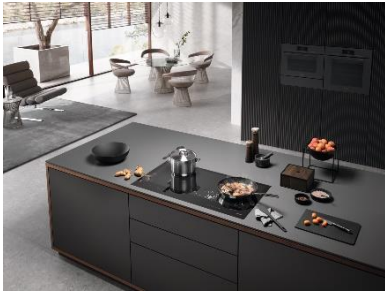
Foto 2: Miele Küchengeräte unterstützen auch in diesem Jahr die Kandidatinnen und Kandidaten der Sendung MasterChef Schweiz.