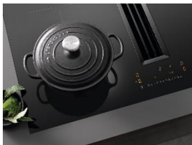
Foto 1: Das Miele-Induktionskochfeld KMDA 7272 Silence gewinnt den iF Design Award 2023 für sein markantes und gleichzeitig elegantes Design und ist reddot winner 2023.