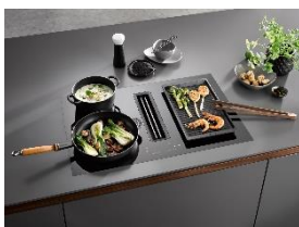
Foto 2: Ausgezeichnet mit dem iF Design Award 2023 und reddot winner 2023: Das Modell KMDA 7473 Silence, bei dem zwei Kochzonen mit einer Brückenfunktion zusammengeschaltet werden, wie etwa für die Gourmet-Grillplatte.