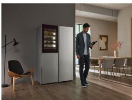
Foto 6: Seite an Seite: Genusszentrum mit Wein-Gefrier-Kombination und Kühlschrank von Miele. Der Weintemperierschrank bietet Platz für eine erlesene Auswahl von 44 Flaschen. (Foto: Miele)

Foto 5: Die neue Generation Weinschränke von Miele wartet mit innovativen Features auf: eine besonders vibrationsarme und damit leise Lagerung, UV-Schutz und individuell einstellbare Luftfeuchtigkeit («ActiveHumidity»). (Foto: Miele)