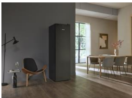
Foto 4: KWT 4584 E sw – Der neue Weinlagerschrank von Miele ist mit seinem grossen Platzangebot und einer Temperaturzone ideal für die Lagerung im Keller oder Vorratsraum. Er fasst beachtliche 229 Flaschen. (Foto: Miele)

Foto 3: PresenterFrame: Wahlweise Lagerung oder Präsentation von edlen Tropfen, noch einmal schöner durch die individuell einstellbare Beleuchtung. Selbst geöffnete Flaschen können hier aufbewahrt werden. (Foto: Miele)