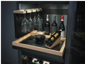
Foto 2: Zur stilvollen Präsentation erlesener Weine: Einzigartiges SommelierSet von Miele. Hier können selbst geöffnete Flaschen aufbewahrt werden. Das Tablett ist entnehmbar und mit einer rutschfesten Auflage ausgestattet. (Foto: Miele)

Foto 1: KWT 4999 F sw – Hingucker für anspruchsvolle Weinliebhaber: Weintemperierschrank von Miele mit drei unabhängig einstellbaren Temperaturzonen und individuell einstellbarer Luftfeuchtigkeit («ActiveHumidity») sowie SommelierSet zur Präsentation oder zum Dekantieren der Weine. (Foto: Miele)