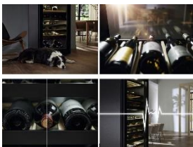
Foto 5: Die neue Generation Weinschränke von Miele wartet mit innovativen Features auf: eine besonders vibrationsarme und damit leise Lagerung, UV-Schutz und individuell einstellbare Luftfeuchtigkeit («ActiveHumidity»). (Foto: Miele)

Foto 4: KWT 4584 E sw – Der neue Weinlagerschrank von Miele ist mit seinem grossen Platzangebot und einer Temperaturzone ideal für die Lagerung im Keller oder Vorratsraum. Er fasst beachtliche 229 Flaschen. (Foto: Miele)