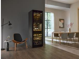
Foto 1: KWT 4999 F sw – Hingucker für anspruchsvolle Weinliebhaber: Weintemperierschrank von Miele mit drei unabhängig einstellbaren Temperaturzonen und individuell einstellbarer Luftfeuchtigkeit («ActiveHumidity») sowie SommelierSet zur Präsentation oder zum Dekantieren der Weine.