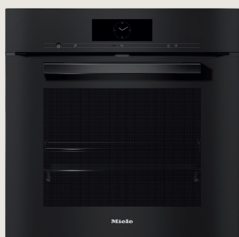
H 7860 BP

Draadloze spijzenthermometer, BrilliantLight & FoodView.