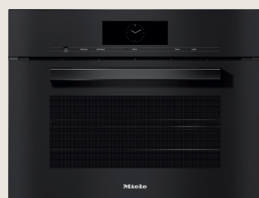
DGC 7840 HC Pro

Gezond koken met automatische programma's & spijzenthermometer.