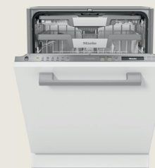
G 7260 SCVi

Volledig integreerbare vaatwasser met energie-efficiëntieklasse A.