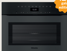
Four avec micro-ondes