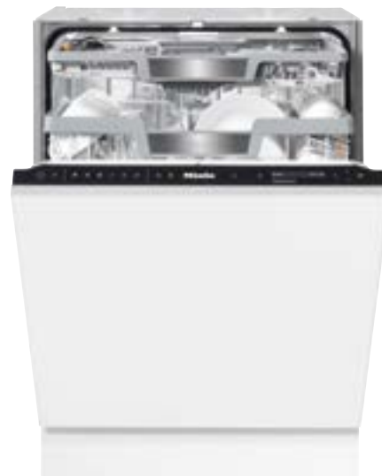
Abbildung zeigt PFD 104 SCVi XX