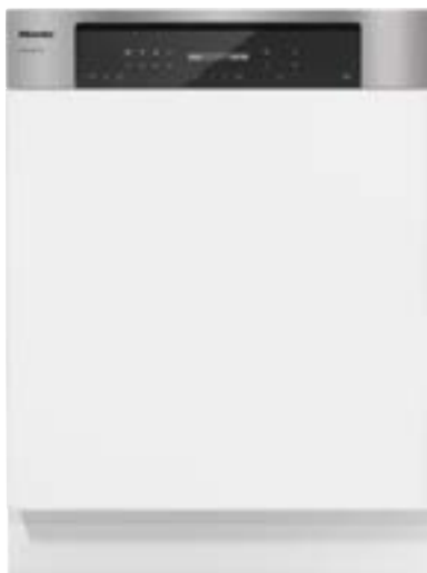
Abbildung zeigt PFD 102 i