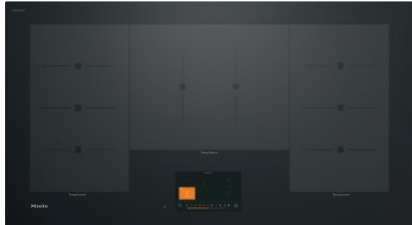
Table de cuisson à induction avec TempControl pour un rôissage parfait