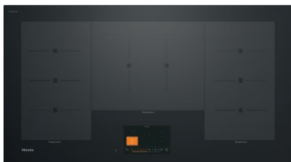
Table de cuisson à induction avec TempControl pour un rôissage parfait

Code EAN: 4002516164753 / Numéro de matériel: 11128800 / Ancien Numéro de matériel: 26799970D