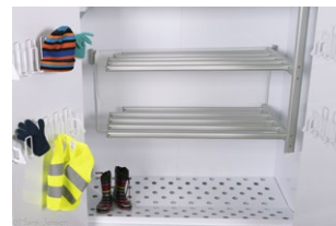
Skoställ och vanthängare ingår